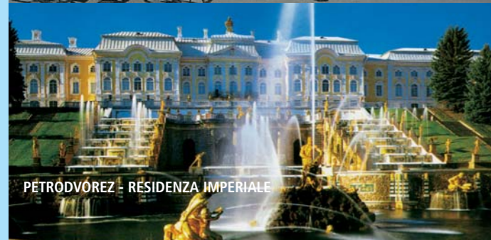
PETRODVOREZ - RESIDENZA IMPERIALE